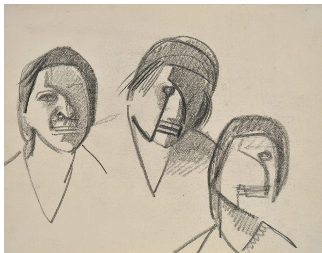
Cabezas Julio González (1876-1942)