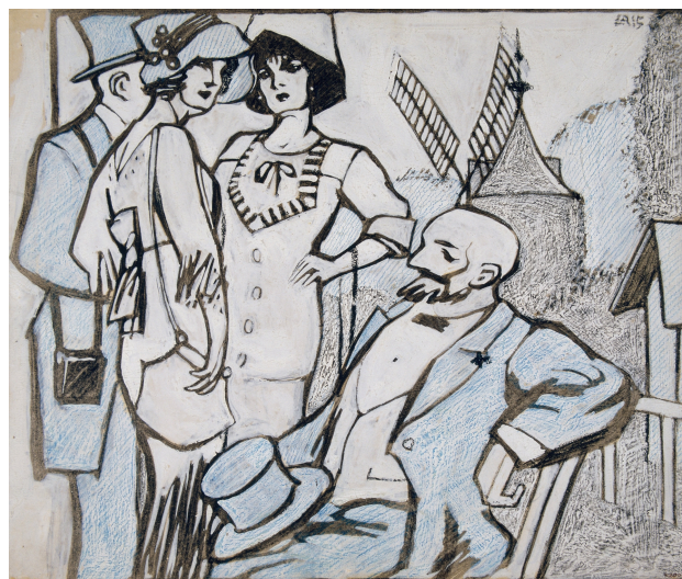
Cursos auxiliares de Longchamps Juan Gris (1887-1927)